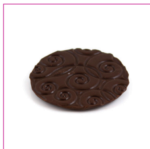
DIVC515 1,200 kg Flik puur