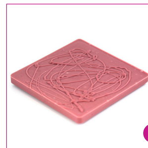
DIVC521 16 stuks à 100 gram Reep ruby massief