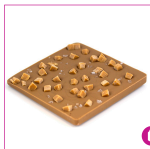
DIVC531 16 stuks à 100 gram Reep melk karamel zeezout