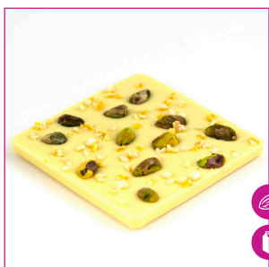
DIVC525 16 stuks à 100 gram Reep wit pistache sinaasappel