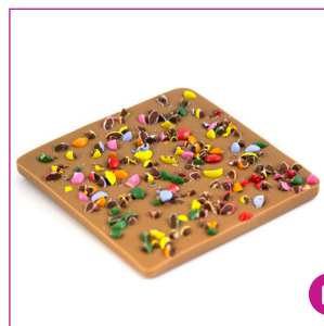
DIVC519 16 stuks à 100 gram Reep melk lentilles