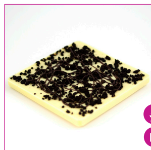
DIVC543 16 stuks à 100 gram Reep wit cookies

Alles kan sporen bevatten van pinda, noten, soja, sesam en melk