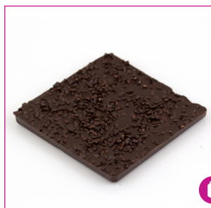
DIVC541 16 stuks à 100 gram Reep extra puur 70% massief