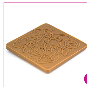
DIVC529 16 stuks à 100 gram Reep melk massief