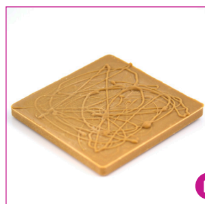
DIVC535 16 stuks à 100 gram Reep karamel massief