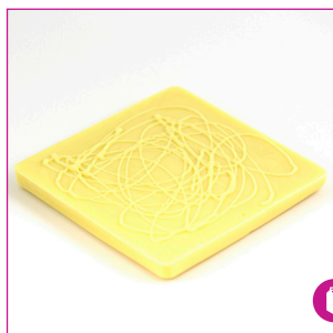
DIVC517 16 stuks à 100 gram Reep wit massief