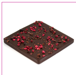
DIVC539 16 stuks à 100 gram Reep puur framboos cacaonibs