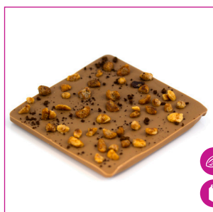
DIVC533 16 stuks à 100 gram Reep melk hazelnoot koffie