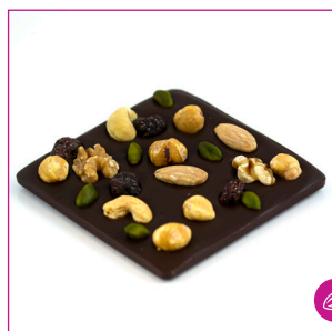
DIVC527 16 stuks à 100 gram Reep puur noten