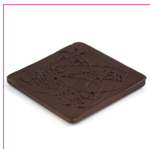
DIVC523 16 stuks à 100 gram Reep puur massief