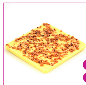
DIVC537 16 stuks à 100 gram Reep wit yoghurt framboos